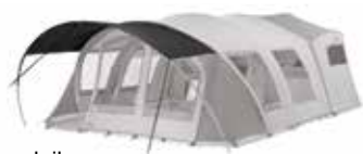
Pare-soleil Sun canopy Réf. PFCHAMONIPTPSOLE