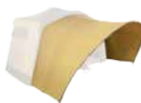
Grand pare-soleil Large sun canopy Réf. PFCHAMONIGPSOLE