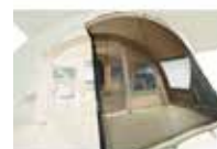
Façade tulle Mesh panel Réf. PFCHAMONIXPSOLETS