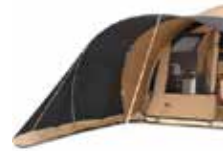
Joue Windbreaked Réf. PFCHAMONIXPSOLEJ