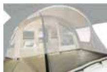
Tapis de sol du pare soleil Sun canopy groundsheet Réf. PFCHAMONIXPSOLETS